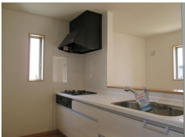
収納たっぷり、お料理らくらく！